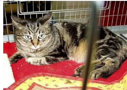
RW SGM St. Lászlói Sissy Princess