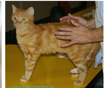
RW SGM Tommy