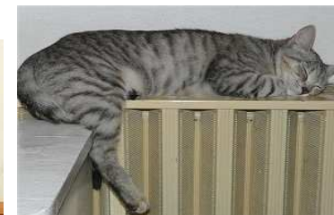
RW Jeanne D'Arc